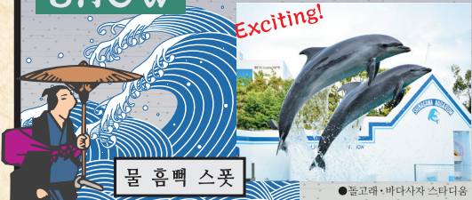
물 흠뻑 스폿