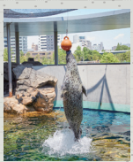
● 바다표범관 1F