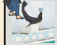
● 돌고래·바다사자 스타디움

귀여운 바다사자들이 유쾌한 쇼를 펼칩니다. 가족이 모두 함께 즐길 수 있습니다.