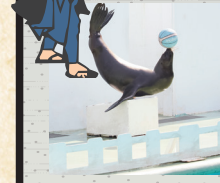
●海豚與海獅展演場